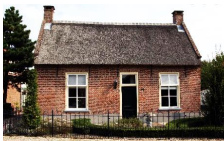
roomboterfabriek Horssen 1898-1913

het dichtsbijzijnde dorp of de stad. Maar toen eind 19e eeuw gaandeweg steeds meer tussenhandelaren verschenen, gingen die zich in toenemende mate ook richten op de frauduleuze in- en verkoop van boter van de boterfabriekjes. Met name in Zuid- Nederland, maar ook elders, leidde dat ertoe dat er coöperatief in menige centrale gelegen plaats