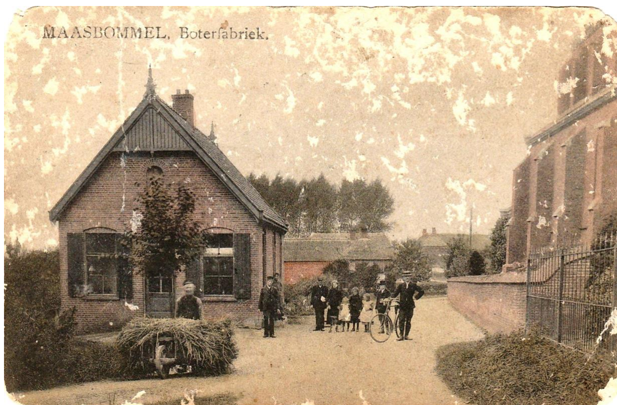
Coöperatieve roomboterfabriek 'Onze Eendracht', 1913 Maasbommel