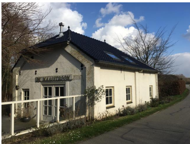
voormalige boterfabriek De Maasstroom in Appeltern, 1913-1935 2020

roomboterfabriek op coöperatieve grondslag nog lang in ons dorp tot de vrome wenschen zou hebben behoord.