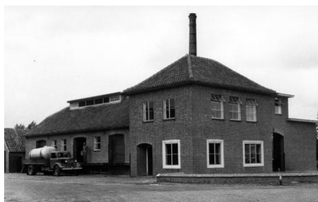
stoomboterfabriek Horssen 1913-1967