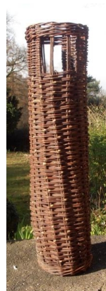
granaatmand voor een 15 cm houwtiser

Gedurende de WO-I bleef Nederland neutraal, maar "de oorlog was buitengewoon lucratief voor ons land. Er werden enorme winsten gemaakt en sommige bescheiden familiebedrijfjes groeiden uit tot een bloeiende onderneming....Tot grote ergernis van beide oorlogvoerende landen at Nederland al die tijd van twee walletjes" 9 .