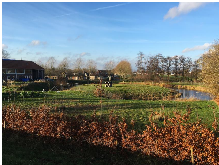
de meest historische plek van Maasbommel, anno februari 2020

Ongeveer ten tijde van dit laatste verbond wordt in 1403 en 1425 Rutger van Bommel beleend met de " Die Hofstad tot Bommel' met 8 morgen lants daer sij inne legen is, met der heerlicheyt ende heuren tobehoren, manne, dienstmanne ende koermoetsche luyde, die daerto behoren; item den uterweert tot