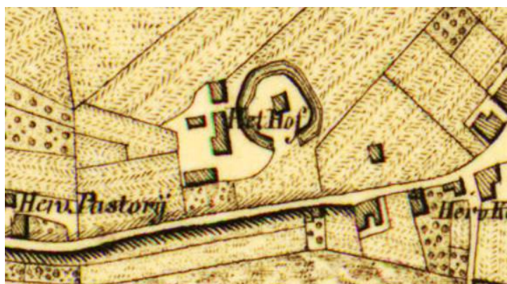
situatie in 1853