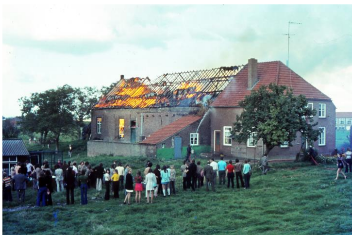
In juli 1972 ontstond een enorme brand in de boerderij.