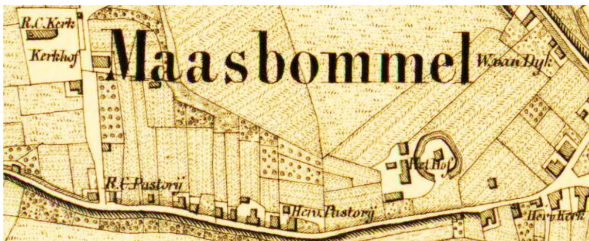
Op deze kaart uit 1853 is linksboven de 'tijdelijke' R.K.- te zien naast het kerkhof en de oude R.K.-pastorie op de hoek van Kerkstraat en Maasbandijk.