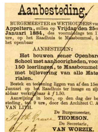
Provinciale Noordbrabantsche en 's-Hertogenbossche Courant, 29-12-1883