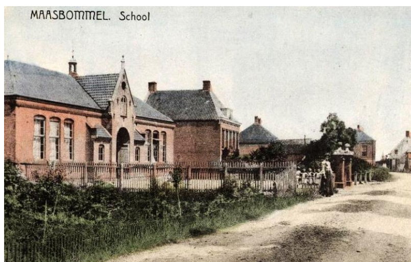
openbare school (1884-193) aan de Maasbandijk te Maasbommel