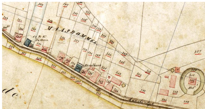
Detail uit de kadastrakaart van 1821 met (in het midden) het 'schoolhuis'