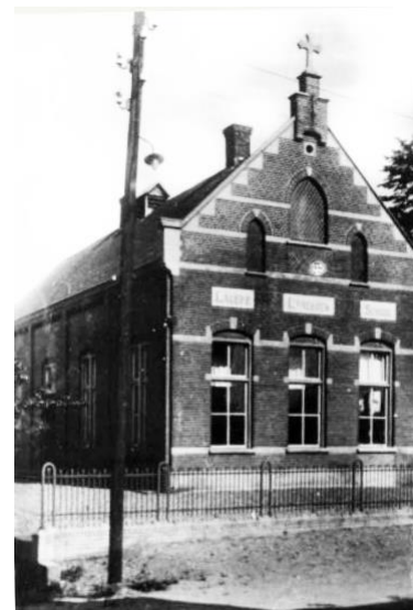
Lagere Landbouwschool in Boven-Leeuwen, 1930

werden er ook particuliere landbouw-, tuinbouw-, en bosbouwscholen opgericht die vaak na enige tijd wel door de overheid (provincie, gemeenten) gesubsidieerd werden. Al in 1897 was er in Tiel een 'Rijkstuinbouwinterschool' (tot 1923) opgericht en in 1928 werd in Oss door de N.C.B. een 'landbouwwinterschool' opgericht met twee jaar les in de winterperiode. Maar in datzelfde jaar, 1928, op 21 september, bracht de Commissaris van de Koningin in Gelderland, mr. S. baron van Heemstra een werkbezoek aan Maas en Waal om zich op de hoogte te stellen van wat er in dit gebied zou moeten gebeuren om de land- en tuinbouw tot 'grotere bloei' te brengen. De burgemeesters van Wamel, Dreumel en Appeltern waren daarbij aanwezig en wezen op het grote belang van het oprichten een Lagere Landbouwschool in de streek. Het jaar daarop was een commissie al bezig met de uitwerking van het schoolplan en de financiële dekking: subsidies van de betrokken gemeenten, bijdragen van de leerlingen, bijdragen van de boerenbonden en leningen van boerenleenbanken 28 . Op donderdag 30 oktober 1930 was het zover: de (rooms-katholieke) Lagere