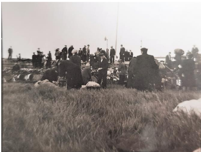
Inschepen aan Blauwe Sluis voor de evacuatie.

ze wakker van hard gebrom in de lucht en zag een groot aantal vliegtuigen met kruizen op de romp boven zich. De Tweede Wereldoorlog was begonnen! Tiny is er nog een paar dagen gebleven voordat ze terugfietste naar Maasbommel.