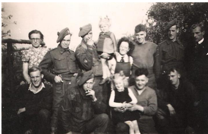
Een deel van de familie Daanen met Schotse soldaten; Privéarchief W.J.D.

Het Land van Maas en Waal was bevrijd maar de slag om Arnhem ging ondanks alle inzet verloren. De oorlog was nog niet voorbij en het was nog lang niet veilig. De Duitsers hadden het voor het zeggen aan de noordzijde van de rivier de Waal, op nog geen zeven kilometer van Maasbommel. Nijmegen en het Land van Maas en Waal kwamen in de frontlinie te liggen. Na de mislukte opmars bij Arnhem,