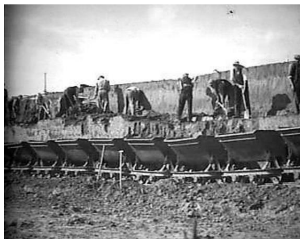
Het vullen van de kiepkarretjes; Bron: Nationaal Archief

De arbeiders kregen een karig loon dat vaak maar een fractie meer was dan de werkloosheidsuitkering. De meesten van hen kwamen uit het westen en midden van het land maar er waren er ook uit de directe omgeving. De westerlingen waren het zware werk in de klei niet gewend en hadden het daarom extra moeilijk. Het gezegde 'de Maas recht en de ruggen krom' zal vast door één van deze mannen uitgesproken zijn.