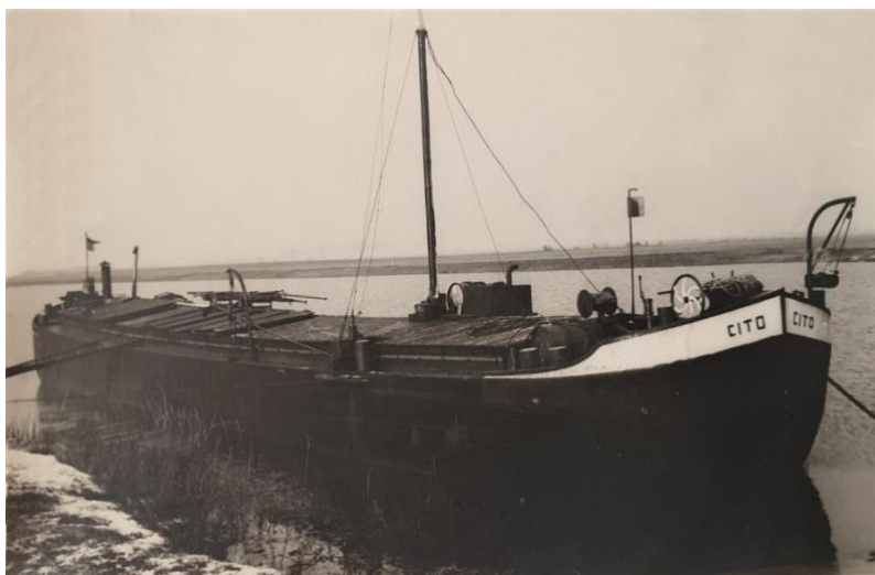
Vrachtschip CITO afgemeerd in Maasbommel, najaar 1944