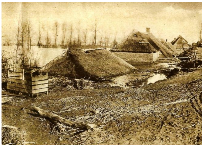
Zwaar beschadigde huizen aan de Maasdijk in Maasbommel tijdens de watersnood van 1926.

Tineke kwam bij een postbode in Helvoirt terecht. Het gezin was hervormd net als de