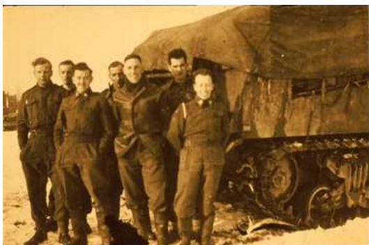
Links 20 : Een Sexton Mk.II. De Sexton was een gecombineerd Brits-Canadees stuk gepantserde mobiele artillerie.

De bewapening van deze Houwitsers bestond uit een 25 Ponder kanon, een .50 machinegeweer en twee .303 inch machinegeweren. Het voertuig had een gewicht van 25,3 ton en had 6 bemanningsleden.