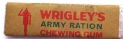
Hierboven en hiernaast 19 : Afbeeldingen van Engelse chocolade, sigaretten en kaun gum.