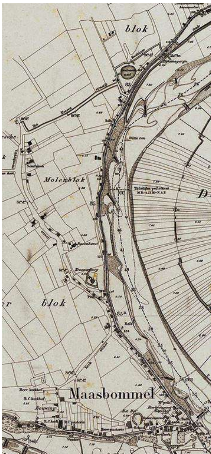
detail kaart uit 1898 de (vermoedelijke) rijswaarden donker gekleurd