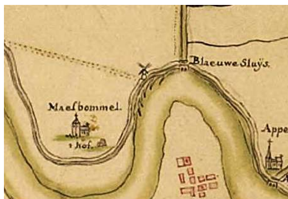
detail kaart uit 1755

werden voor grote afvoeren van water en ijs, een grote rol moesten spelen bij de aanpak van de overstromingen" 3 .