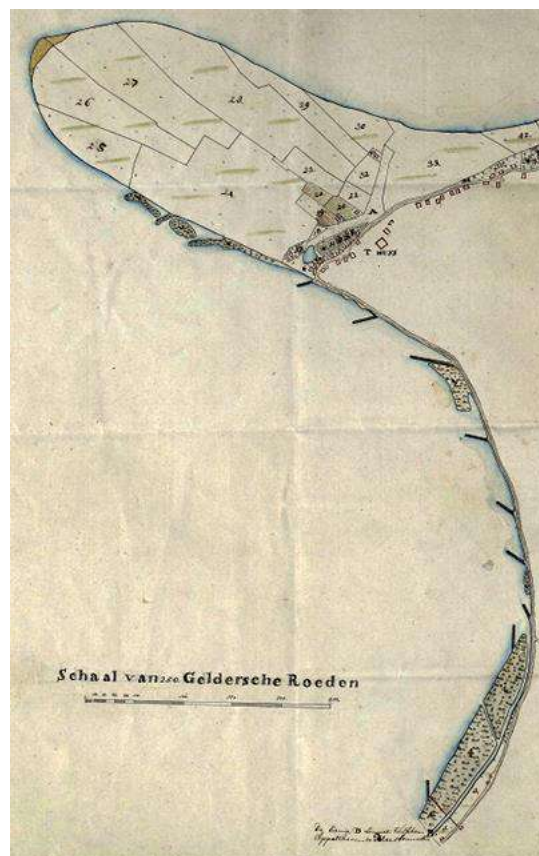
detail uit kaart van 1778: kribben met rijswaarden langs de Bovendijk tot de Blauwe Sluis (=onder)