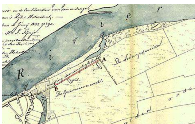
aangelegde kade en rijswaard bij de Schaapsweide, 1832

In 1830 wordt vastgesteld dat er in de Maas tussen Appeltern en Schans Andries maar liefst 85 door particulieren aangelegde kribben en 'hoofden' zijn geteld 7 .