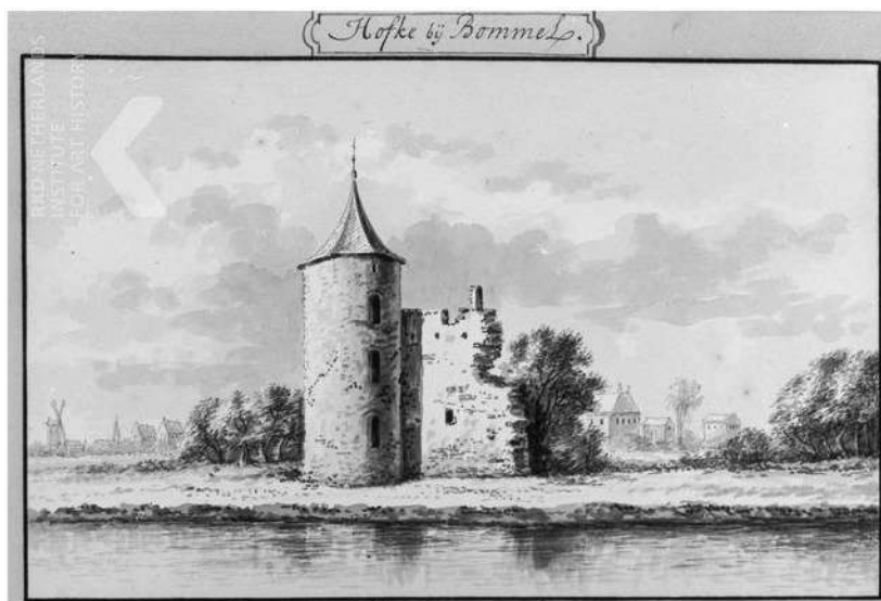
Waarschijnlijk ruïne van het Hof bij Maasbommel Abraham Rademaker, dat. 1718-1730