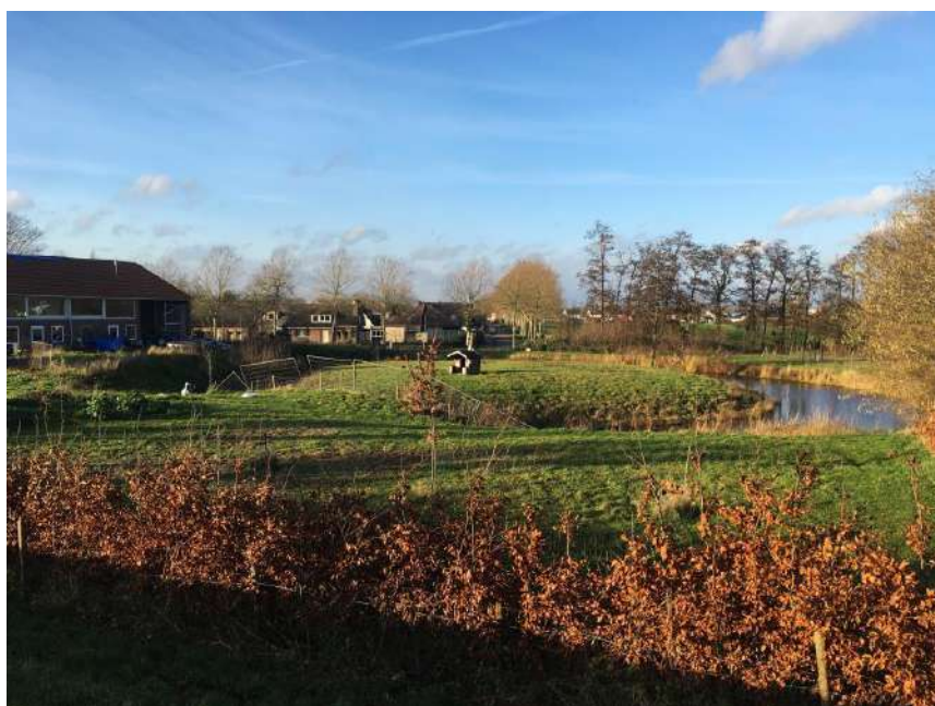
de meest historische plek van Maasbommel, anno februari 2020

Ongeveer ten tijde van dit laatste verbond wordt in 1403 en 1425 Rutger van Bommel beleend met de " Die Hofstad tot Bommel' met 8 morgen lants daer sij inne legen is, met der heerlicheyt ende heuren tobehoren, manne, dienstmanne ende koermoetsche luyde, die daerto behoren; item den uterweert tot