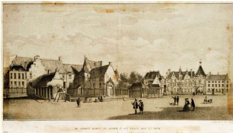
Links op de markt te Arnhem het Hof, ongeveer waar nu het provinciehuis staat; Jan de Beijer, 1742, Collectie Gelders Archief

In civiele kwesties moest het oordeel door de Maasbommelse richter en schepenen (bijgestaan door een secretaris) geveld worden, zeker als het Maasbommelaars betrof. In criminele kwesties was de ambtman bij uitsluiting tot strafvervolging bevoegd. Voor hoger beroep moest men vanaf 1617 niet meer naar het hof in het toenmalige Spaanse