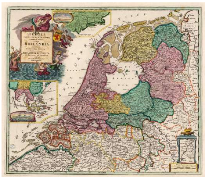
Republiek der Zeven Verenigde Nederlanden, Johann B. Homann (mogelijk), voor 1729

De Staten-Generaal bestond uit afgevaardigden van de zeven 'Provinciale Staten'. Eind 16e eeuw kreeg het al een vaste vergaderruimte aan het Binnenhof in Den Haag, vlak bij het gebouw van de Staten van Holland die als vertegenwoordigers van het destijds meest welvarende gewest ook het meest invloedrijk waren. De vergadering werd wel ieder week voorgezeten door een afgevaardigde van een ander gewest.