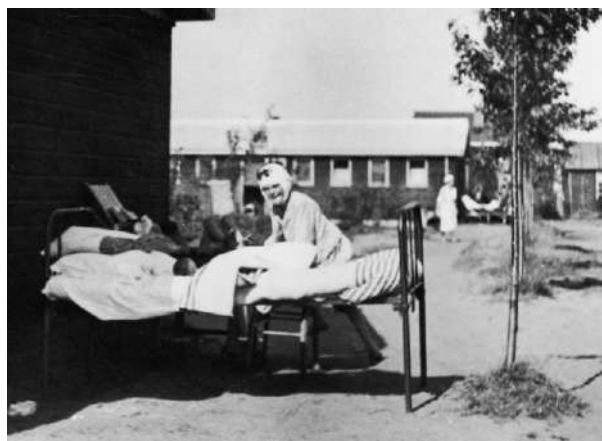
ziekenhuisbed op een mooie zomerdag in kamp Westerbork