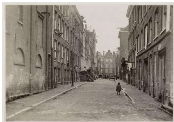
Foeliedwardsstraat Amsterdam anno 1930

Nog binnen een jaar (4 oktober 1919) werd het jonge gezin verblijd met een tweede zoon. Uiteraard kreeg ook hij naar goed Joods gebruik een Bijbelse naam: Salomon, wat in het Hebreeuws vermoedelijk de betekenis heeft van 'de vreedzame'.