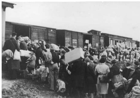
Eén van de ruim 100 transporten Vanuit kamp Westerbork