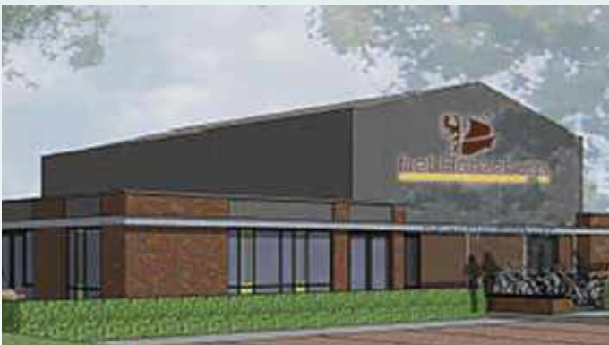
Realisatie van een nieuw MFA geeft een sterke impuls aan gemeenschappelijke activiteiten

Realisatie van een nieuw MFA geeft een sterke impuls aan gemeenschappelijke activiteiten.