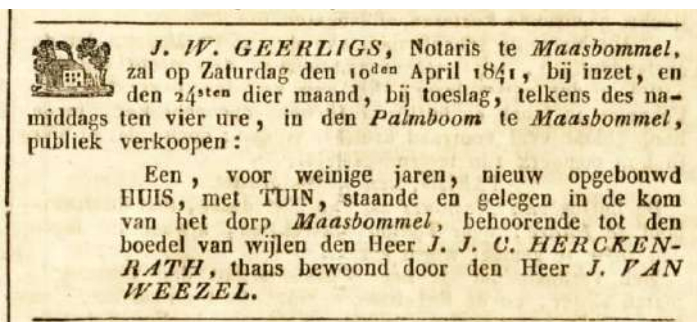
advertentie uit de Provinciale Geldersche en Nijmeegsche courant van 3 april 1841