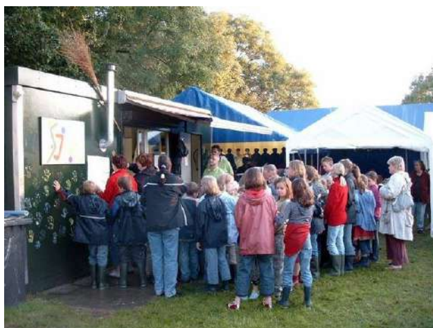
Foto rechts: De keet op het oude voetbalveld, o.a. bedoeld voor de verkoop van snacks, koffie, thee, limonade en tevens bedoeld als de noodzakelijke locatie voor de EHBO.

Foto hierboven: Het voorbereiden van de ballen gehakt voor het "broodje bal".