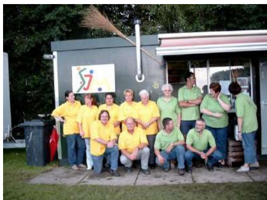
Foto links en rechts: Enkele van de vele vrijwilligers die zich beschikbaar stelden voor hulp aan het jeugdkamp.