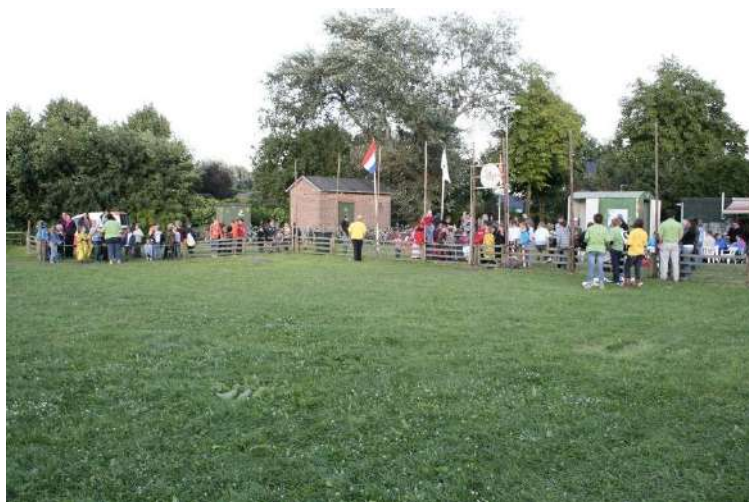
Foto links: Het jeugdkamp op het oude voetbalveld aan de Kerkstraat: Op de donderdag, vrijdag en zaterdag ochtend met z'n allen verzamelen aan de ingang van het bouwterrein en wachten op het startsein van de vrijwilligers dat je het terrein op mag. Zo ging dat al op de Kampstraat, de Kerkstraat maar ook nu op de Hogenhofstraat.