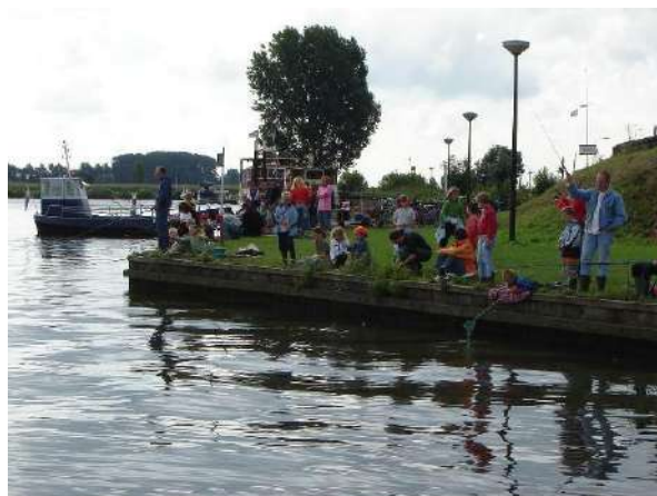
Foto rechts: Vissen aan de Maas. Aas aan de haak en afwachten wie de meeste "lengte aan vis" vangt.

Het jeugdkamp was niet alleen leuk voor de kinderen, maar ook voor de ouders. Zij hielpen de kinderen mee met het bouwen van het dorp. Daarnaast waren er ook veel activiteiten georganiseerd waaraan het hele dorp kon meedoen, zoals de dropping, de fietstocht, samen vissen en op de laatste avond een groot slotfeest met muzikale ondersteuning van de Edelweiss-kapel uit Maasbommel. Iedereen zat dan gezellig om het grote kampvuur.