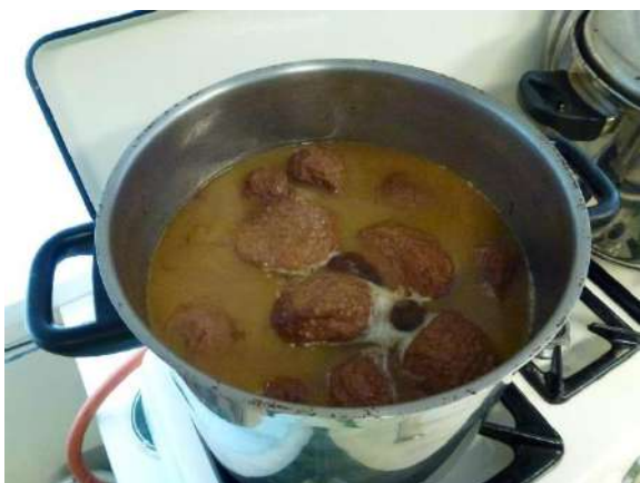
Foto hierboven: Het voorbereiden van de ballen gehakt voor het "broodje bal".