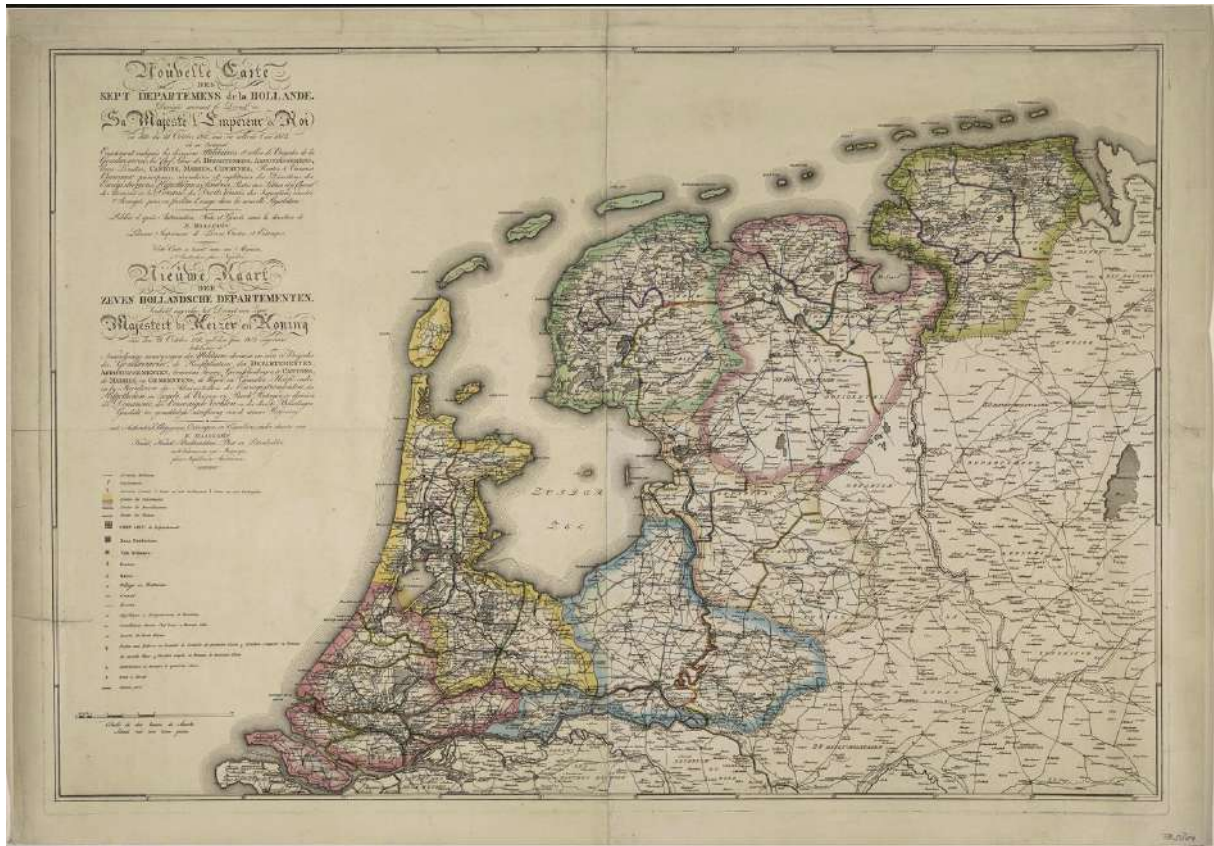
1811, Maas en Waal als onderdeel van het ('Belgische') Département des Bouches du Rhin van het Franse keizerrijk

Bij het Franse decreet van 21 oktober 1811 werd bepaald dat er departementen, arrondissementen, kantons en gemeenten moesten ontstaan (en o.a. de burgerlijke stand werd ingevoerd).