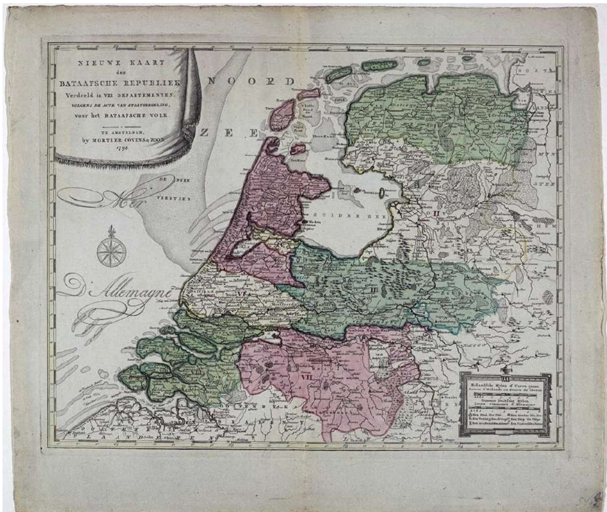
1798, Maas en Waal als onderdeel van het 7e Departement van de Dommel

In het rampjaar 1672, trekken 150.000 Franse troepen van Lodewijk XIV vanuit het oosten ons land binnen maar worden uiteindelijk door een 'waterlinie' tegengehouden. Maas en Waal wordt slechts enkele jaren bezet maar bij hun terugtrekking in 1676 wordt Maasbommel door de (rooms-katholieke) Fransen geplunderd en wordt er het kasteel 'het Hof' platgebrand. Het daar bewaarde middeleeuwse archief gaat in vlammen op. De laatste stuip trekking van het 'ancien régime' in Maas en Waal.