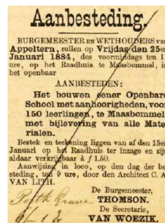
Provinciale Noordbrabantsche en 's-Hertogenbossche Courant, 29-12-1883

openbare schoolhuis en de onderwijzerswoning uit 1846 een nieuwe openbare school met drie klassen gereed (zie bijlage). De onderwijzer gaat tijdelijk in de naastgelegen woning van de voormalige dokter wonen 7 . Een nieuwe grotere school was geen overbodige luxe want aan kinderen is in die tijd geen gebrek. In 1888 gaan er in Appeltern, Altforst, Maasbommel en Alphen respectievelijk 75, 56, 96 en 118