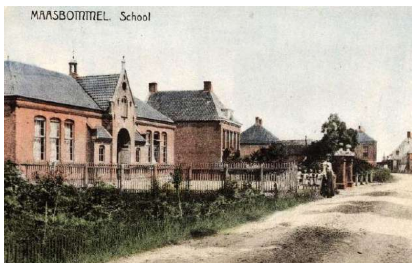
openbare school (1884-193) aan de Maasbandijk te Maasbommel