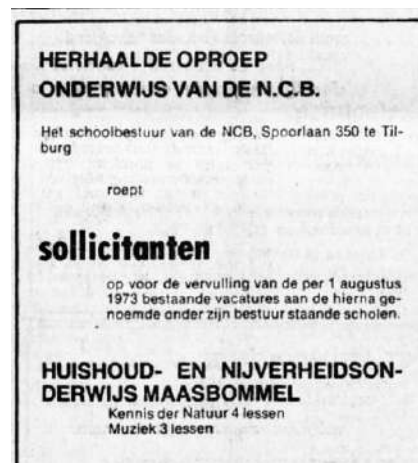
De Volkskrant 16-6-1973

Ondanks de mooie start van de N.C.B. R.K. Huishoudschool is slechts negen jaar later al een terugloop van het aantal leerlingen waar te nemen. Vooral de assistentenklas heeft het zwaar. Slechts zeven meisjes hebben zich in het voorjaar van 1967 aangemeld voor deze klas. Het is reden voor het gemeentebestuur om aan de huishoudschool in Druten te verzoeken minstens acht leerlingen af te staan aan Maasbommel om het minimale aantal van 15 leerlingen te halen. Huishoudschool Druten heeft een boventallig aantal leerlingen en wil wel meewerken. De reisafstanden zijn echter een probleem en dat zal eerst opgelost moeten worden. De gemeenteraad Appellern