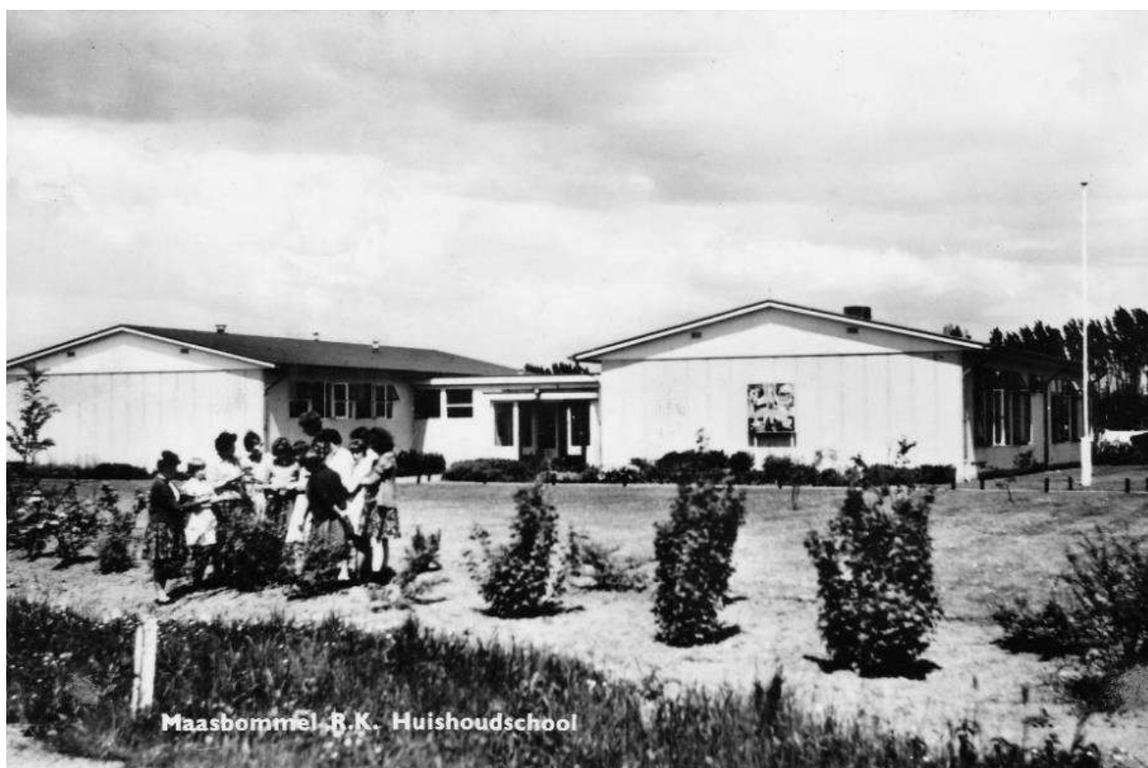
Maasbommel B.K. Huishoudschool