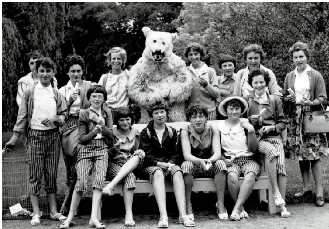
Uitstapje naar Ouwehands Dierenpark 23-6-1960