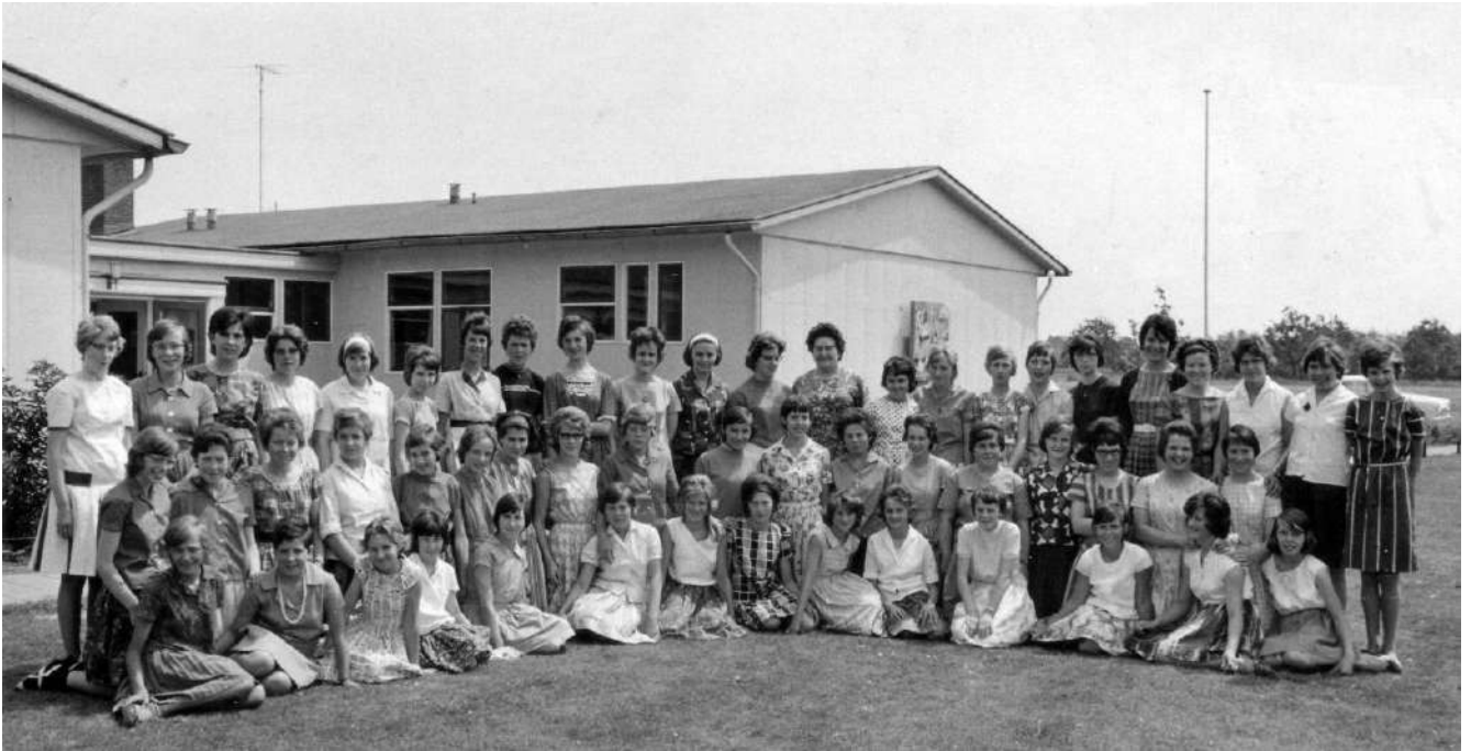
1963-1964; klas 1, 2 en 3; M= Maasbommel, A= Alphen, AL= Altforst, AP= Appeltern, D= Dreumel