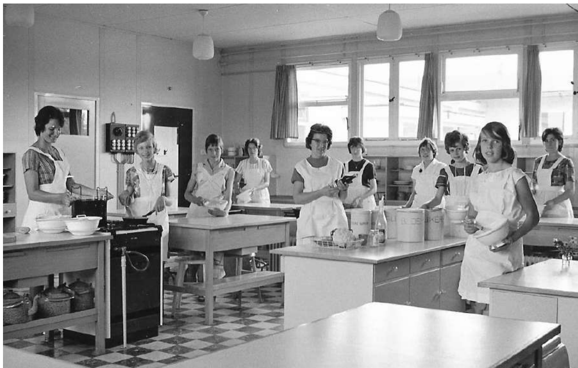
Kooklessen voor klas 2 in schooljaar 1963-1964; M= Maasbommel, A= Alphen, AL=Altforst, D= Dreumel