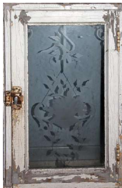
loketraampje