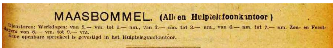
Naamlijst voor den Telefoondienst 1920

In de 'Naamlijst voor den Telefoondienst 1920', uitgave Januari 1920 wordt onder Maasbommel alleen vermeld dat er sprake is van een Hulptelefoonkantoor; particuliere aansluitingen op het telefoonnet ontbreken kennelijk nog.