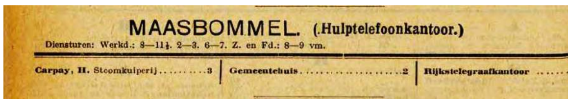
Naamlijst voor den Telefoondienst 1922