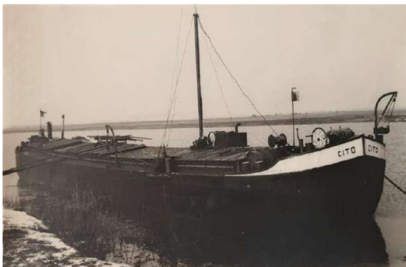
Vrachtschip CITO afgemeerd in Maasbommel, najaar 1944