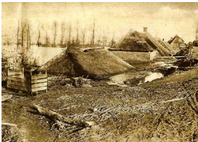
Zwaar beschadigde huizen aan de Maasdijk in Maasbommel tijdens de watersnood van 1926.

Tineke kwam bij een postbode in Helvoirt terecht. Het gezin was hervormd net als de