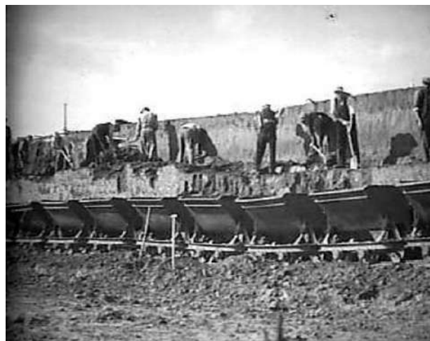
Het vullen van de kiepkarretjes; Bron: Nationaal Archief

De arbeiders kregen een karig loon dat vaak maar een fractie meer was dan de werkloosheidsuitkering. De meesten van hen kwamen uit het westen en midden van het land maar er waren er ook uit de directe omgeving. De westerlingen waren het zware werk in de klei niet gewend en hadden het daarom extra moeilijk. Het gezegde 'de Maas recht en de ruggen krom' zal vast door één van deze mannen uitgesproken zijn.