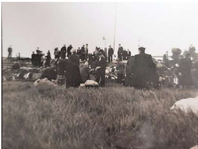
Inschepen aan Blauwe Sluis voor de evacuatie.

ze wakker van hard gebrom in de lucht en zag een groot aantal vliegtuigen met kruizen op de romp boven zich. De Tweede Wereldoorlog was begonnen! Tiny is er nog een paar dagen gebleven voordat ze terugfietste naar Maasbommel.