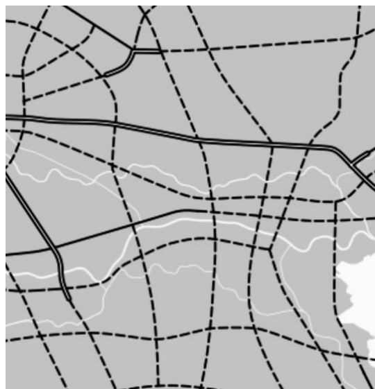
Detail uit het Structuurschema Hoofdwegennet 1966 waarin Maas en Waal doorsneden wordt door 5 snelwegen.

De eerste decennia na de Tweede Wereldoorlog zouden worden gekenmerkt door het geloof in het nut en de noodzaak van rationale planning en schaalvergroting op tal van maatschappelijke terreinen. De bevolking nam snel toe, de woningnood was hoog, de automobiliteit nam snel toe en de steden werden uitgebreid met grote stadswijken, opgebouwd uit buurten met wijk- en buurtcentra 1 . Licht en lucht waren de uitgangspunten; het 'gesloten bouwblok' werd vervangen door een open wijkbebouwing met veel sociale woningbouw, vaak bestaande uit hoogbouw met galerijflats. Aan de rand van de stad ontstonden grote industrieterreinen. Stedenbouw werd een nieuwe discipline naast architectuur. De Verenigde Staten van Amerika werden op tal van gebieden ons voorbeeld. Door de verdergaande industrialisatie ontstond de massaproductie van consumptieartikelen. De winkel op de hoek werd vervangen door een steeds groter wordende supermarkt. De welvaart nam toe, er verschenen in de huizen koelkasten, wasmachines en zwart-wit tv's bij degenen die zich de aanschaf daarvan konden permitteren.