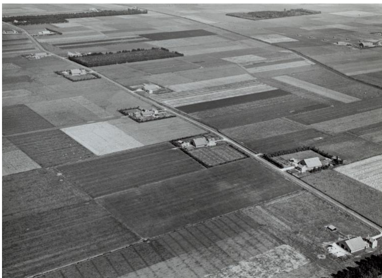
Boerderijstraat in de komgronden van Maas en Waal, 19 juli 1958

bestaande bedrijven, gebruik van machines en kunstmest, een betere ontsluiting, praktische verkaveling (meer 'huiskavels' en minder versnipperde 'veldkavels') en adequate waterbeheersing. Kortom, ook het boerenbedrijf moest productief, groot en efficiënt worden.