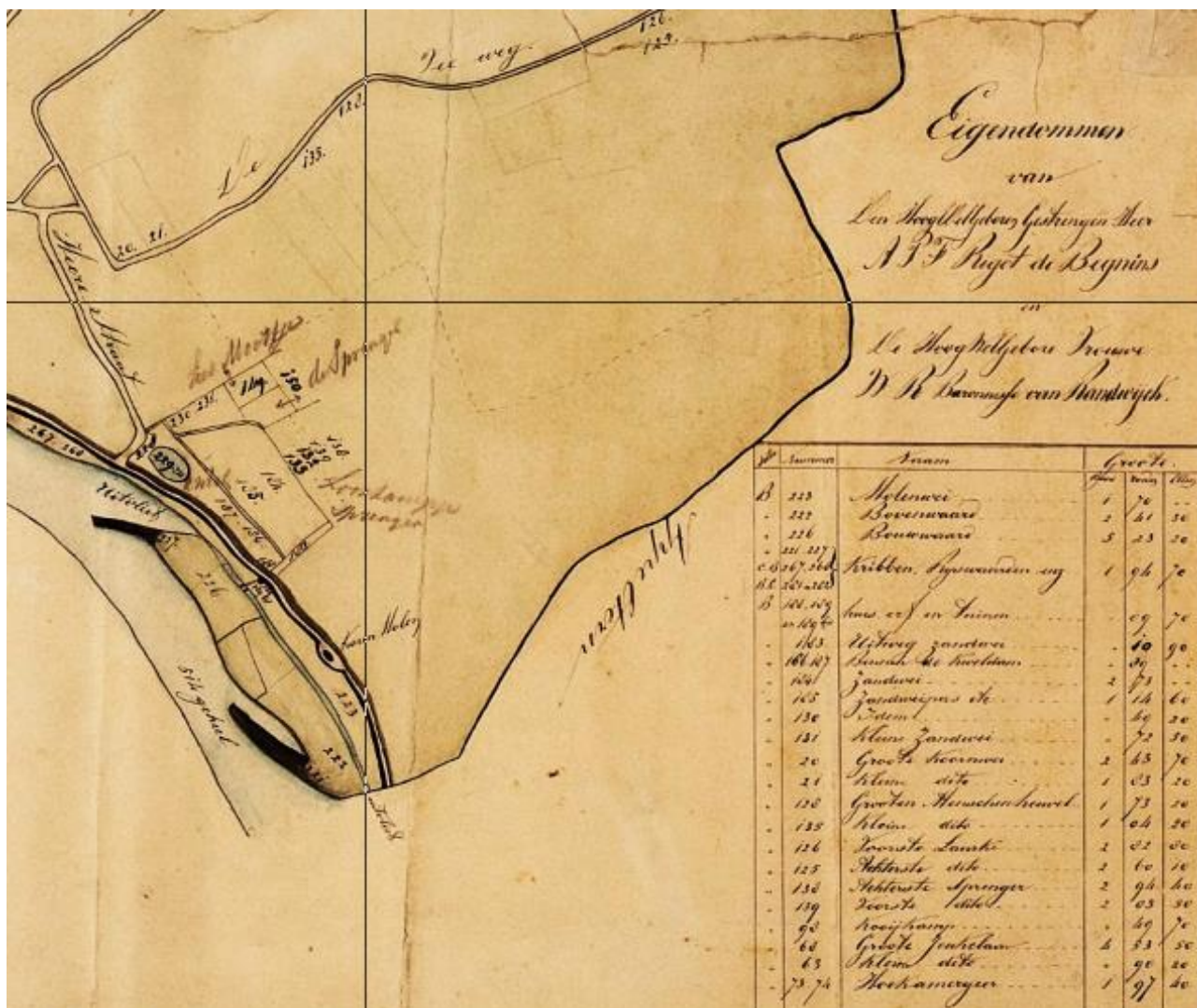
Onderdeel van een figuratieve kaart van Maasbommel met aangegeven de eigendommen van 'Den Hoogwelgeboren gestrengen Heer A.P.F. Rigot de Begnins en de Hoogwelgebore Vrouwe W.R. Baronesse van Randwijck; links boven de Heerstraat die op de Maasbandijk uitkomt.